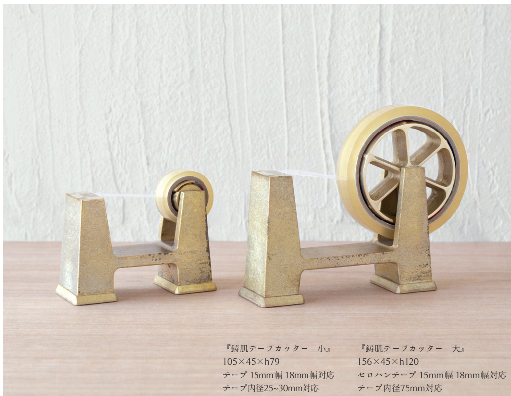
『鑄肌テープカッター 小』